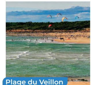
Plage du Veillon