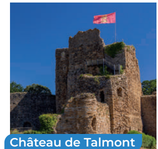
Château de Talmont