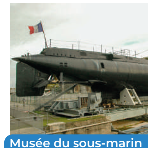
Musée du sous-marin