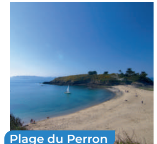
Plage du Perron