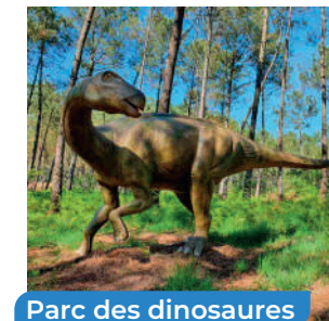
Parc des dinosaures