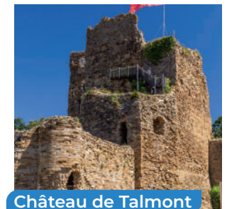
Château de Talmont