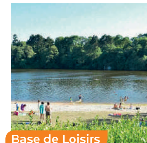
Base de Loisirs